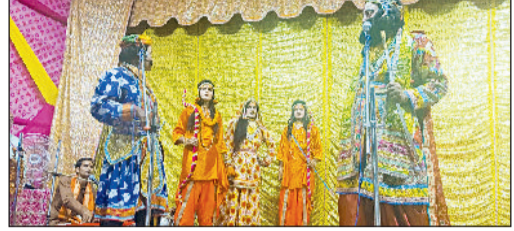
रोहताक। पुरानी आईटीआई में मंचन करते कलाकार।