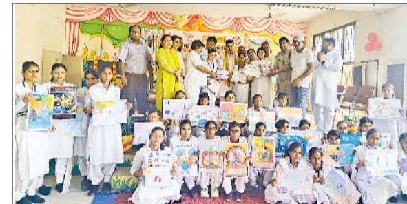
रोहताक। गलर्स सीनियर सेकेंडरी स्कूल में आयोजित चित्रकला स्पर्धा के प्रतिभागी।